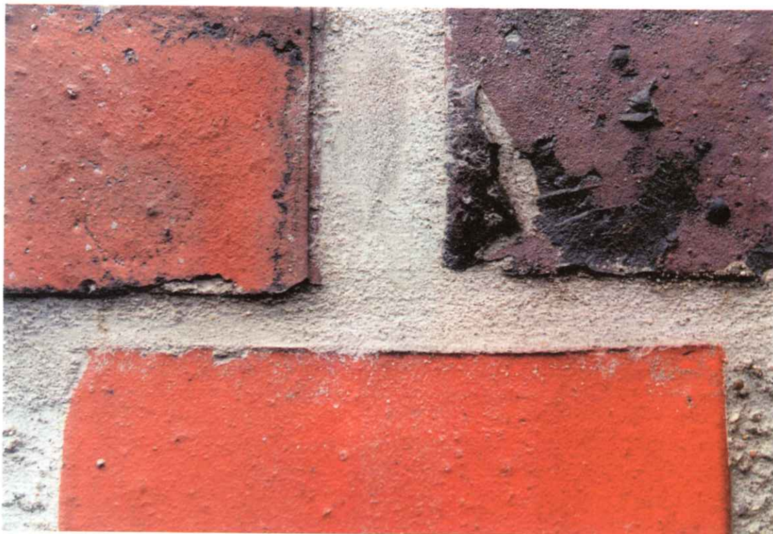
Bild 8: Detailaufnahme eines Sichtmauerwerksabschnittes von Gebäude B