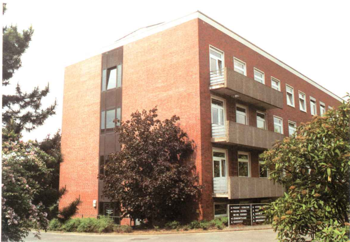
Bild 4: Fassadenansicht Gebäude B (rechter Gebäudeflügel nicht saniert)