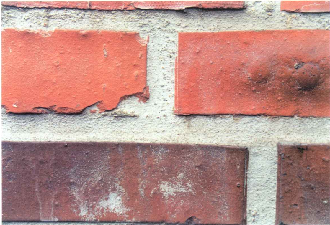
Bild 9: Partielle Mörtelrückstände in Ziegelfehlstellen und rauhen Oberflächen