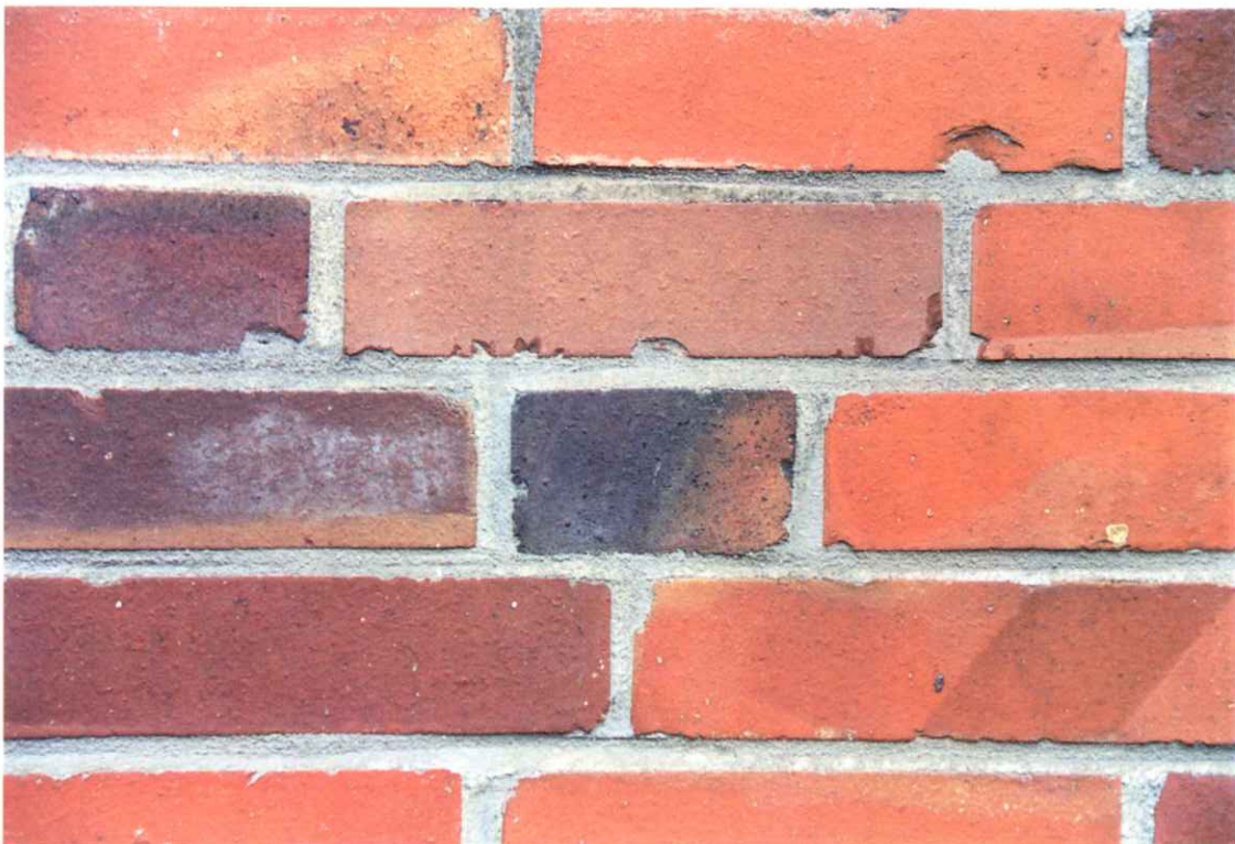
Bild 6: Detailaufnahme eines Sichtmauerwerksabschnittes von Gebäude A